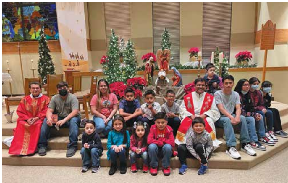
Niños reunidos para programa Navideño